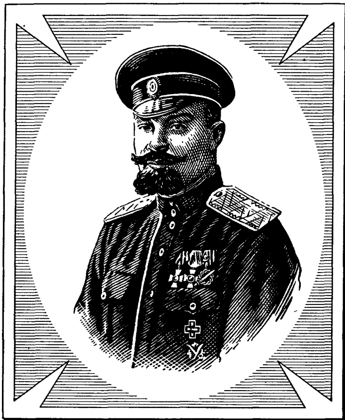
КУТЕПОВ Александр Павлович 1882–1930